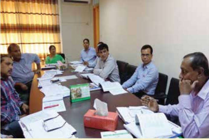
চিত্র ১০: এনএসডিসি সচিবালয়ের অনুষ্ঠিত NSDC Action Plan Monitoring Workshop এর দ্বিতীয় গ্রুপ।

গত ২৫ এপ্রিল ২০১৬ তারিখে এনএসডিসি সচিবালয়ের প্রধান নির্বাহী কর্মকর্তার অফিসকক্ষে দ্বিতীয় কর্মশালাটি অনুষ্ঠিত হয়। উক্ত কর্মশালায় মহিলা ও শিশু বিষয়ক মন্ত্রণালয়, মহিলা অধিদপ্তর, শিল্প মন্ত্রণালয়, SME Foundation, BITAC, NPO, BSCIC এবং বাংলাদেশ কেমিক্যাল ইন্ডাস্ট্রিজ কর্পোরেশনের প্রতিনিধিরা সহ মোট ১২ জন অংশগ্রহণকারী উপস্থিত ছিলেন। সভাপতি প্রধান নির্বাহী কর্মকর্তা, এনএসডিসি সচিবালয় অনুষ্ঠানের সবাইকে স্বাগত জানায় এবং টিভিইটি সেক্টর এ NTVQF এর ভূমিকা, চাহিদা ও যোগানের মধ্যে সম্বন্ধের জন্য Skill Data System গঠনের উপর গুরুত্ব প্রদান ইত্যাদির সম্পর্কে আলোচনা করেন।