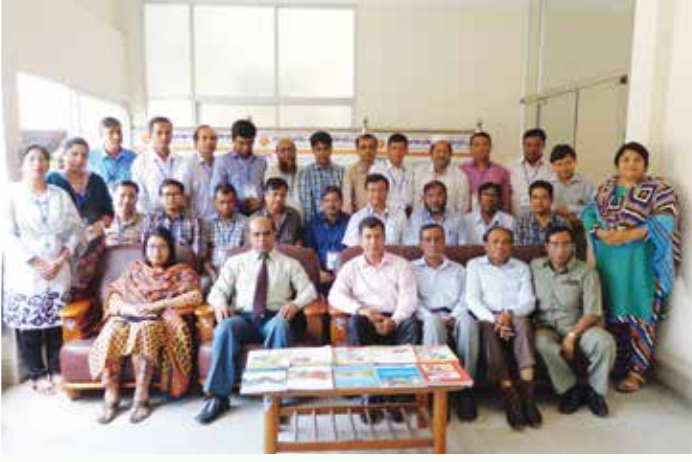
চিত্র ৫: এনএসডিসি সচিবালয়ের অনুষ্ঠিত 'Research Methodology' শীর্ষক প্রশিক্ষণ কর্মশালার দ্বিতীয় ব্যাচ।

techniques, designing questionnaire, research proposal preparation, data analysis, test of hypothesis, management of research project, monitoring and controlling ইত্যাদি বিষয়ে ব্যাপক আলোচনা ও প্রশিক্ষণ প্রদান করা হয়।