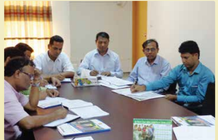
চিত্র ৯: এনএসডিসি সচিবালয়ের অনুষ্ঠিত NSDC Action Plan Monitoring Workshop এর প্রথম গ্রুপ।