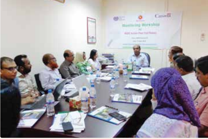
চিত্র ১৩: এনএসডিসি সচিবালয়ের অনুষ্ঠিত NSDC Action Plan Monitoring Workshop এর চতুর্থ গ্রুপ।

গত ২৭ এপ্রিল ২০১৬ তারিখে এনএসডিসি সচিবালয়ের প্রধান নির্বাহী কর্মকর্তার অফিসকক্ষে চতুর্থ কর্মশালাটি অনুষ্ঠিত হয়। স্বাগত ভাষণে সভাপতি প্রধান নির্বাহী কর্মকর্তা, এনএসডিসি সচিবালয়, NTVQF এর সফল বাস্তবায়নে শ্রমিকদের উপযুক্ত ভাতা প্রদান করবে বলে উল্লেখ করেন এবং Assessor pool গঠনের উপর গুরুত্ব দেন।