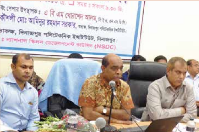
চিত্র ১৭: কর্মশালায় পেপার উপস্থাপন করছেন এনএসডিসি সচিবালয়ের সিইও।

“টিভিইটি প্রশিক্ষকদের ডেমোনস্ট্রেশন এর মাধ্যমে শ্রেণীকক্ষ পাঠদান সক্ষমতা বৃদ্ধিকরণ” বিষয়ক কর্মশালা