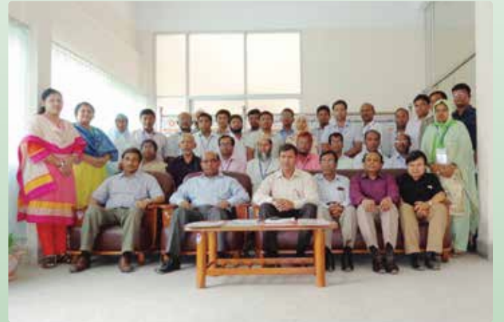
চিত্র ৭: এনএসডিসি সচিবালয়ের অনুষ্ঠিত 'Research Methodology' শীর্ষক প্রশিক্ষণ কর্মশালার তৃতীয় ব্যাচ।

ধরনের দক্ষতা প্রয়োজন, কোথায় প্রয়োজন এবং কি ধরনের কর্মসূচি পরিচালনা করা প্রয়োজন এসব বিষয়ে সঠিক সিদ্ধান্ত গ্রহণ করতে পারবে। প্রশিক্ষণদাতা প্রতিষ্ঠানগুলোকে দেয়া তহবিলের জবাবদিহিতা নিশ্চিত করার জন্য প্রধান শ্রম বাজার ও কর্মসূচি, কারিগরি ও বৃত্তিমূলক শিক্ষা এবং প্রশিক্ষণের সরবরাহের সঙ্গে শিল্পের চাহিদার মিল রাখার জন্য গবেষণা হতে প্রাপ্ত তথ্যের প্রয়োজন হয় যা এ প্রশিক্ষণের মাধ্যমে অংশগ্রহণকারীগণ শিখতে পারবেন বলে তিনি মন্তব্য করেন। ২৪ এপ্রিল ২০১৬ তারিখ Research Methodology