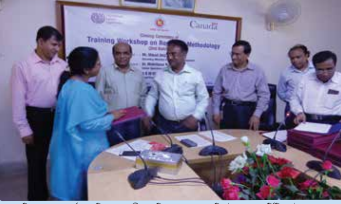
চিত্র ২১: কোর্স সমাপ্তিতে মাননীয় সচিব মহোদয়ের নিকট হতে সার্টিফিকেট গ্রহণ করছেন দ্বিতীয় প্রশিক্ষণ কোর্সের জনৈক অংশগ্রহণকারী।