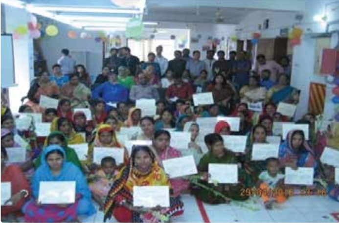
চিত্র ১৬: সুইং অপারেটর পদে সার্টিফিকেট প্রাপ্ত কর্মচারীরা

সেশনে ৩০ জন করে বছরে মোট ৯০ জন যুব মহিলা সম্পূর্ণ বিনামূল্যে এই সেন্টার থেকে প্রশিক্ষণ গ্রহণ করছে। প্রশিক্ষণ চলাকালীন তারা প্রত্যেকে মাসিক ভাতা ২৫০০ টাকা, দৈনিক যাতায়াত ভাড়া ও দুপুরের খাবার, স্বাস্থ্য পরীক্ষা ও চিকিৎসা সেবা এবং প্রশিক্ষণ শেষে সরকারী নির্ধারিত স্কেল অনুযায়ী কম্প্লয়েন্স ফ্যাক্টরীতে চাকুরীর সুযোগ পাচ্ছেন। শিক্ষা, দক্ষতা ও কর্মসংস্থানের