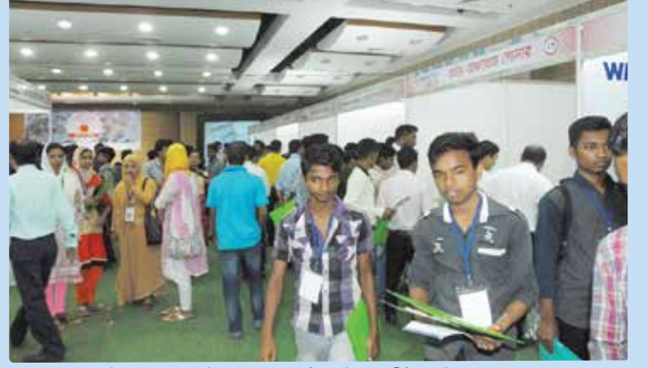
চিত্র ২৪: ইন্ডাস্ট্রিয়াল গামেন্টস প্রশিক্ষণার্থীদের মিলনমেলা।