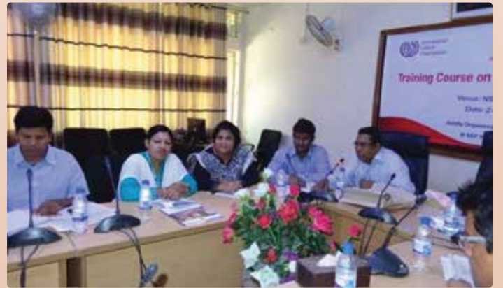
চিত্র ২০: ‘Research Methodology’ শীর্ষক প্রশিক্ষণ কর্মশালার চতুর্থ ব্যাচে অংশগ্রহণকারীগণ।