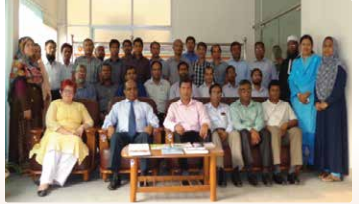
চিত্র ১৮: এনএসডিসি সচিবালয়ের অনুষ্ঠিত ‘Research Methodology’ শীর্ষক প্রশিক্ষণ কর্মশালার চতুর্থ ব্যাচ।