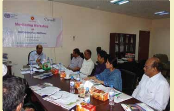
চিত্র ১২: এনএসডিসি সচিবালয়ের অনুষ্ঠিত NSDC Action Plan Monitoring Workshop এর তৃতীয় গ্রুপ।