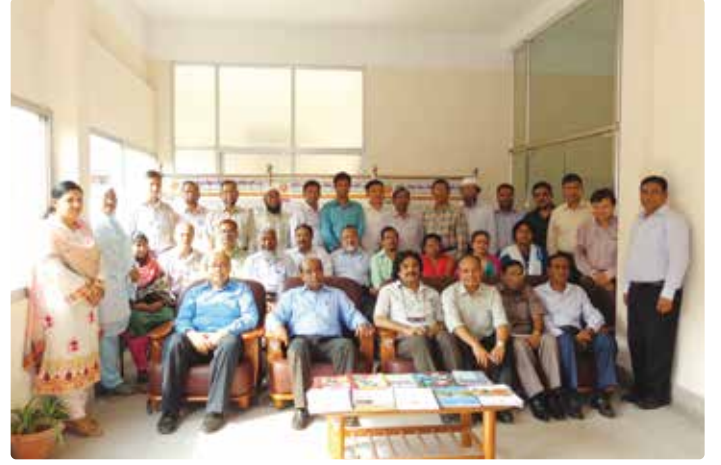
চিত্র ৪: এনএসডিসি সচিবালয়ের অনুষ্ঠিত 'Research Methodology' শীর্ষক প্রশিক্ষণ কর্মশালার প্রথম ব্যাচ।

কর্মশালা শেষে যদি ৮০% অংশগ্রহণকারী ও গবেষণাকর্মে নিয়োজিত হয় ও তা চলমান থাকে তাহলে এ কর্মশালা সার্থক হবে। ৪টি ভিন্ন গ্রুপে ৫ দিনব্যাপী এ কর্মশালা অনুষ্ঠিত হয়। নিম্নে সংক্ষেপে ৪টি গ্রুপের বর্ণনা দেওয়া হলো: