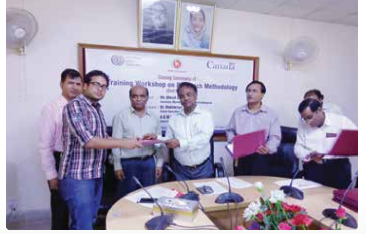
চিত্র ৬: কোর্স সমাপ্তিতে মাননীয় সচিব মহোদয়ের নিকট হতে সার্টিফিকেট গ্রহণ করছেন 'Research Methodology' শীর্ষক দ্বিতীয় প্রশিক্ষণ কোর্সের জনৈক অংশগ্রহণকারী।

মাধ্যমে টিভিইটি সেক্টরে গবেষক পুল তৈরি হচ্ছে এবং অংশগ্রহণকারীগণ এ প্রশিক্ষণে লব্ধ জ্ঞান স্ব স্ব প্রতিষ্ঠানের গবেষণা কার্যক্রম পরিচালনা করতে সক্ষম হবে। তাছাড়া গবেষণার মাধ্যমে দক্ষতার জন্য প্রয়োজনীয় চাহিদা সম্বন্ধে ধারণা লাভ করতে পারবে যা দ্বারা সরকার, নিয়োগকারী কর্তৃপক্ষ, কর্মী এবং অন্যান্য স্টেকহোল্ডাররা কি