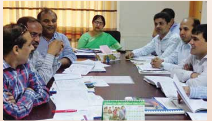
চিত্র ১৯: NSDC Action Plan Monitoring Workshop এর চতুর্থ গ্রুপের প্রতিনিধিগণ।